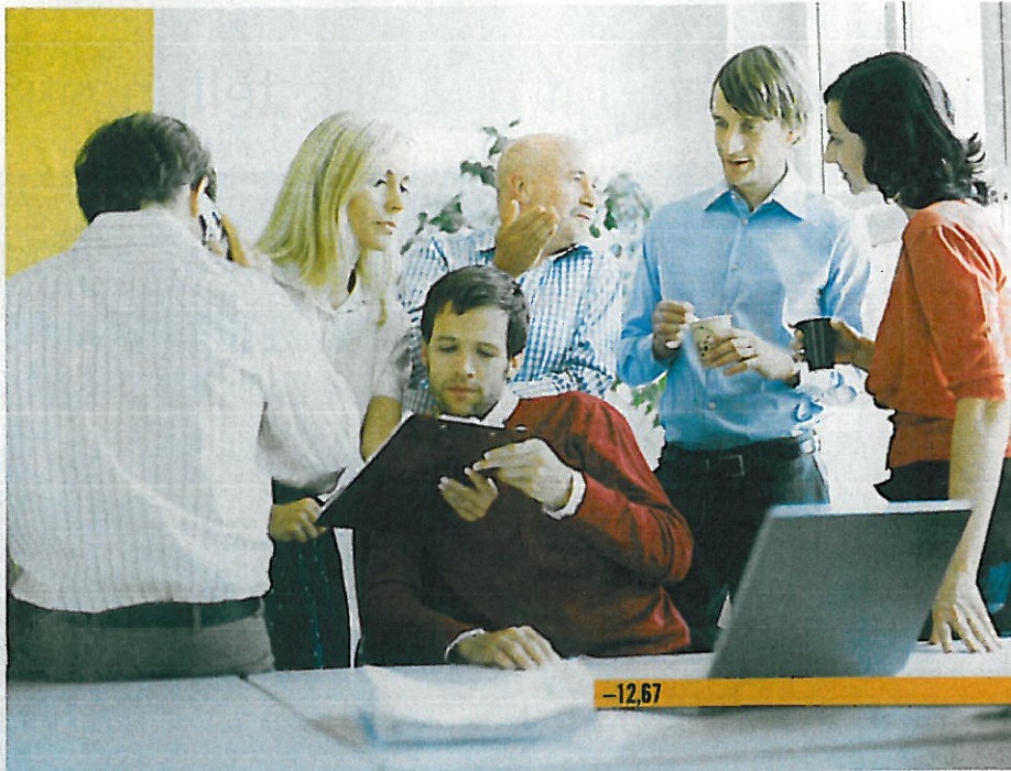
RENDITEVERGLEICH MITARBEITERVORSORGE. Die Zahlen fürs erste Halbjahr sind durchwegs wieder im Plus. Einige Institute müssen aber hohe Verluste vom Vorjahr erst einmal aufholen.